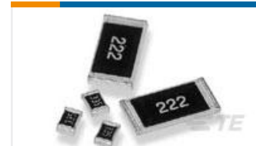
TE 产品编号5-1879501-1 CRGH2512 5% 120R 2W