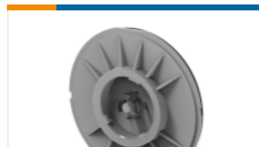
TE 产品编号2213831-2 BASE ASSY, 80MM, VENTED, SEALED