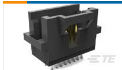
TE 产品编号5-104068-2 10 SYSTEM 50 HDR DRST SHRD