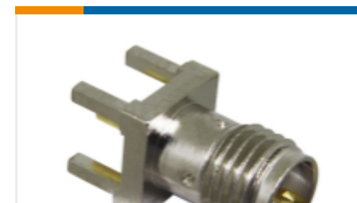
TE 产品编号CONREV SMA001 RP-SMA Jack 50 Ohm PCB Through Hole