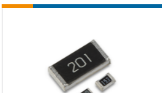
TE 产品编号2-2176328-4 CRGP 1206 820R 1%