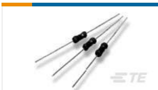
TE 产品编号5-1625892-4 3W SM M/OX 5% 47R