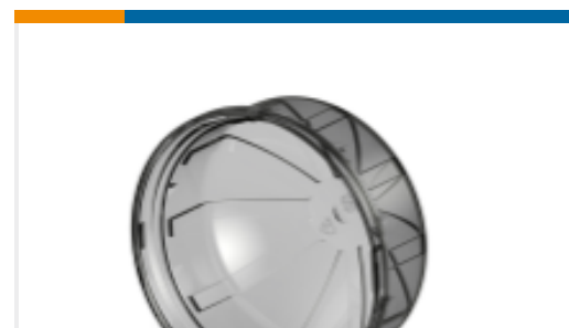
TE 产品编号2328823-2 LUMAWISE S 80MM DIA DOME SMOKE GRAY MED