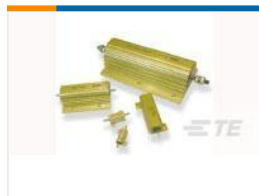
TE 产品编号1-1630019-6 HSC200 2R2 5%