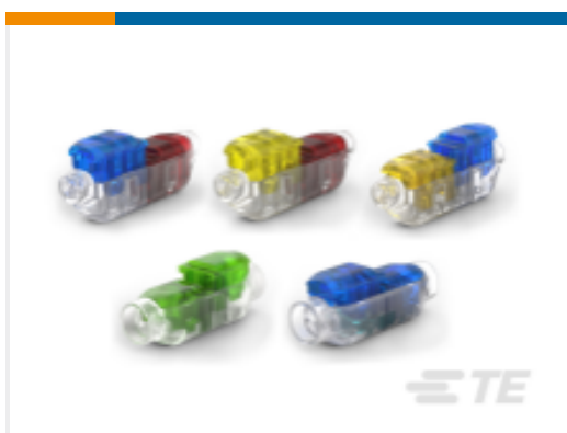
TE 产品编号2213800-4 CoolSplice Quick Connect Splice