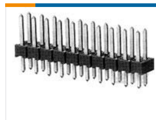
TE 产品编号1-826632-0 10P AMPMODU II PIN HDR.