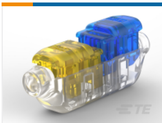
TE 产品编号 2213600-4 COOLSPICE LW 12/14 TO 14/16 AWG