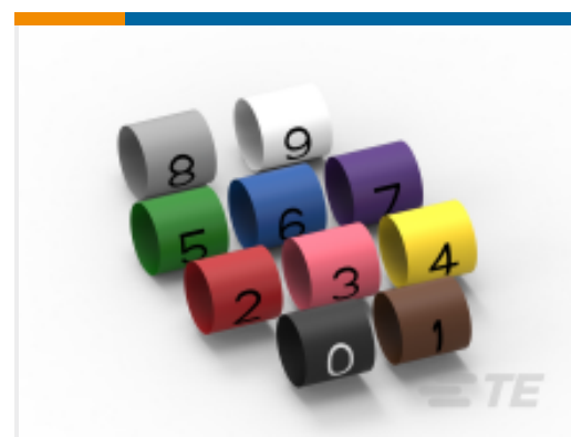
TE 产品编号750585-000 TRSA-1019/C/1/N-KIT