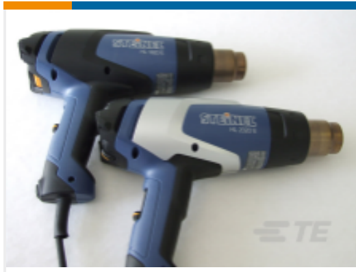
TE 产品编号 EG8162-000 HL1920E-230V-EURO