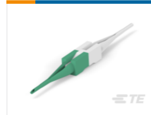
TE 产品编号 M81969-14-01 TOOL INS/REM