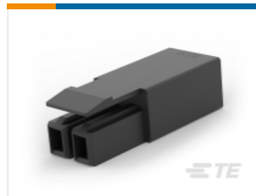
TE 产品编号2834048-1 LIGHT-N-LOK Modular Latched Plugs