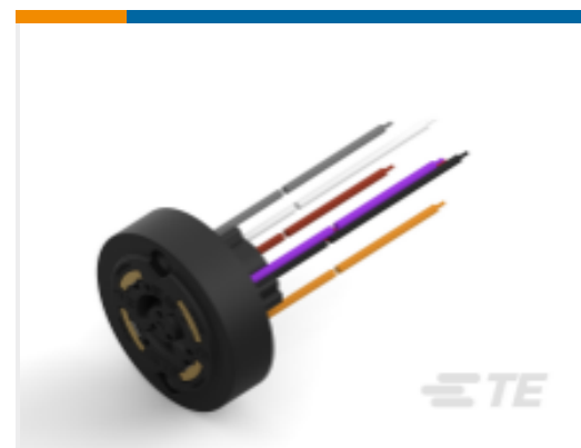
TE 产品编号1-2213362-4 RCPT ASSY, DIMMABLE PHOTOCONTROL, 105C, 3/4