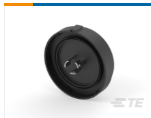
TE 产品编号1-2361116-1 LUMAWISE Endurance N+ Shorting Cap