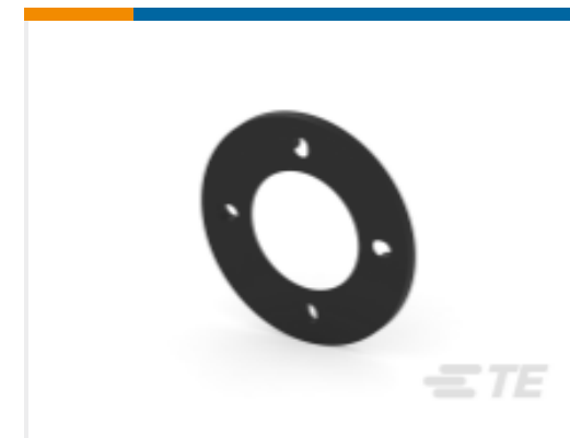
TE 产品编号2213626-1 GASKET, SEALING ROT DIM RECEPT