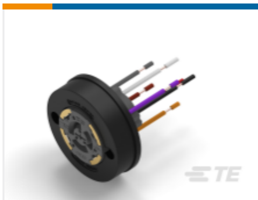
TE 产品编号2213627-4 ASSEMBLY, ROT DIM REC 49.22MM 7 POS 105C