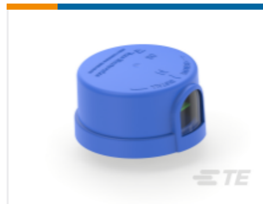
TE 产品编号BB3399-000 ALR-8090-VFS