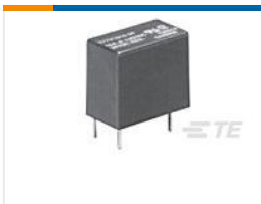
TE 产品编号1-1393194-9 T77VID10-12