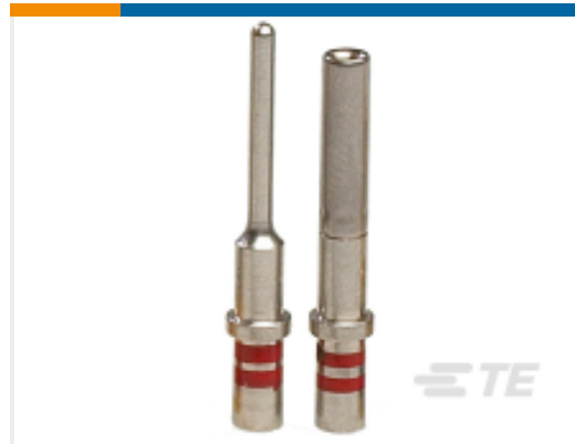
TE 产品编号ZPF00000000001261 097-0267-16 A1267