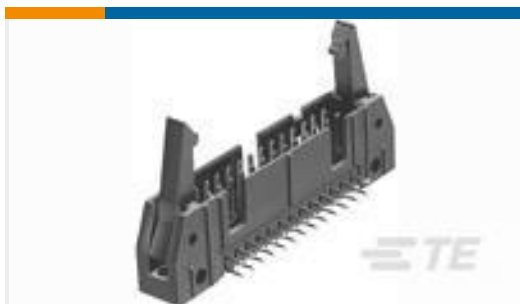
TE 产品编号2-5499141-3 A/L UNIV HDR 16P RA LG LAT BLUE