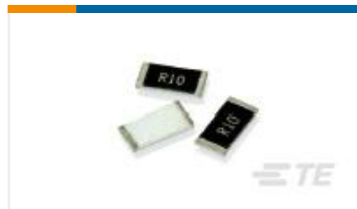
TE 产品编号2176051-8 RLP73N 1J R10 1% 1K RL