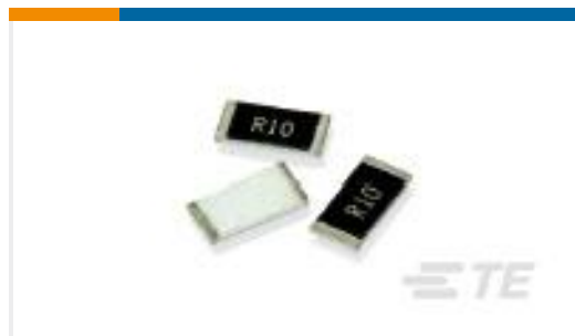
TE 产品编号1-1622825-2 RL73K 3A R15 5% 1K Reel