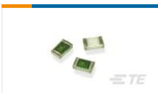
TE 产品编号1-2176087-5 RP 1J 0.166W 95R3 0.1% 25PPM 1K RL