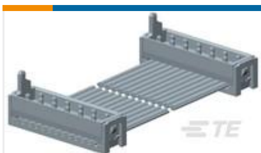
TE 产品编号1483354-1 MICRO-MATCH LEAD 12P 100MM