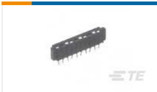
TE 产品编号5-520315-2 TRIOMATE ASSY V 2P L=3.556LDFR