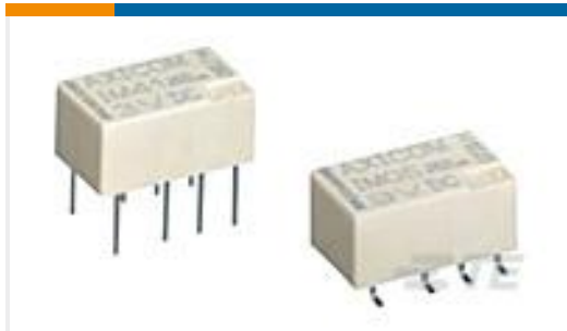
TE 产品编号4-1462037-1 IM04TS=IM RELAY 140mW 6V