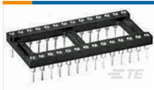
TE 产品编号3-1571552-2 840-AG11D-ESL-LF=800 DIP,GF/SN