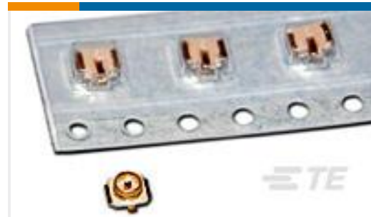
TE 产品编号1909763-1 UMCC MICRO-COAX RECPT GEN 1 HIGHER LEVEL