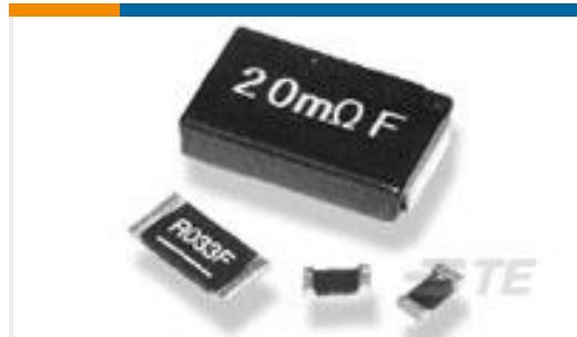
TE 产品编号2176157-6 TLM 2010 0.75W R027 5% 100PPM 4K RL