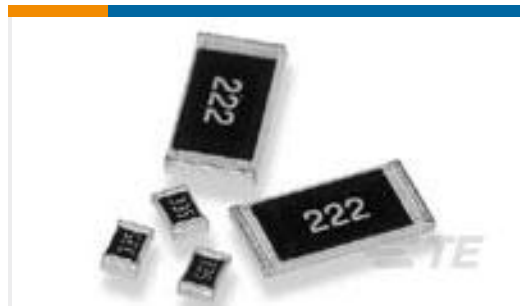
TE 产品编号8-1879512-7 CRGH0805 1% 18R 0.33W