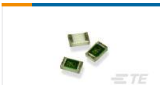
TE 产品编号6-1676481-4 CPF 0603 2K7 0.1% 25PPM 1K RL