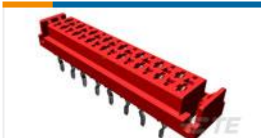
TE 产品编号338068-4 MICRO-MATCH FTE, 4P