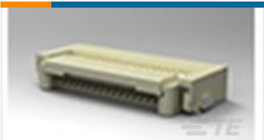
TE 产品编号2-1775333-2 ZIF FPC 0.5, 2H, 22P