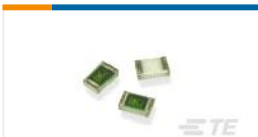
TE 产品编号1-1879134-5 RN 0603 13K7 0.1% 10PPM 1K RL