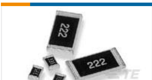
TE 产品编号6-1879501-3 CRGH2512 5% 390R 2W