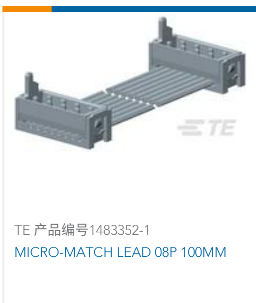
TE 产品编号1483352-1 MICRO-MATCH LEAD 08P 100MM