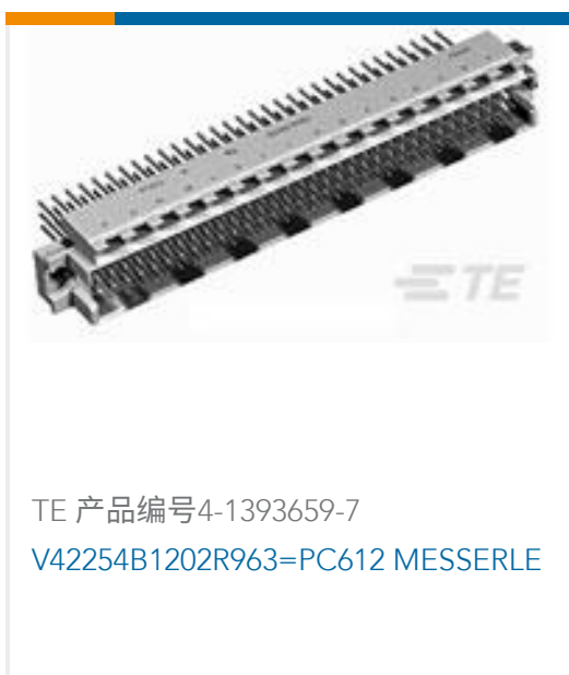
TE 产品编号4-1393659-7 V42254B1202R963=PC612 MESSERLE