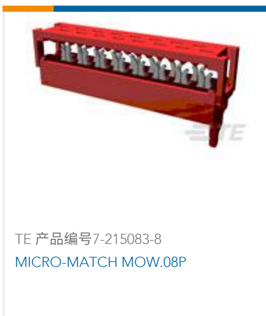
TE 产品编号7-215083-8 MICRO-MATCH MOW.08P