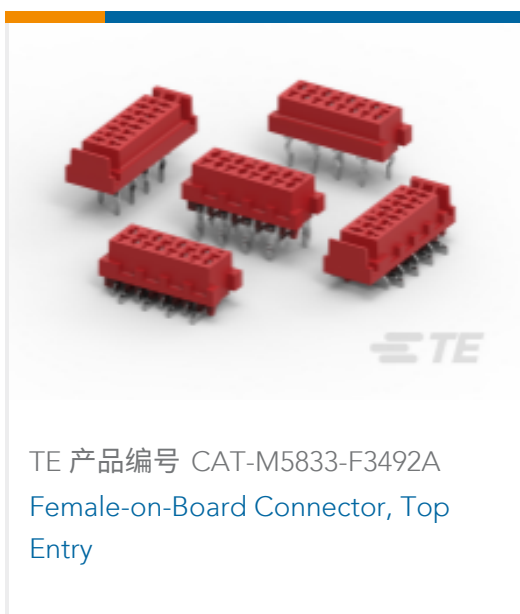
TE 产品编号 CAT-M5833-F3492A Female-on-Board Connector, Top Entry