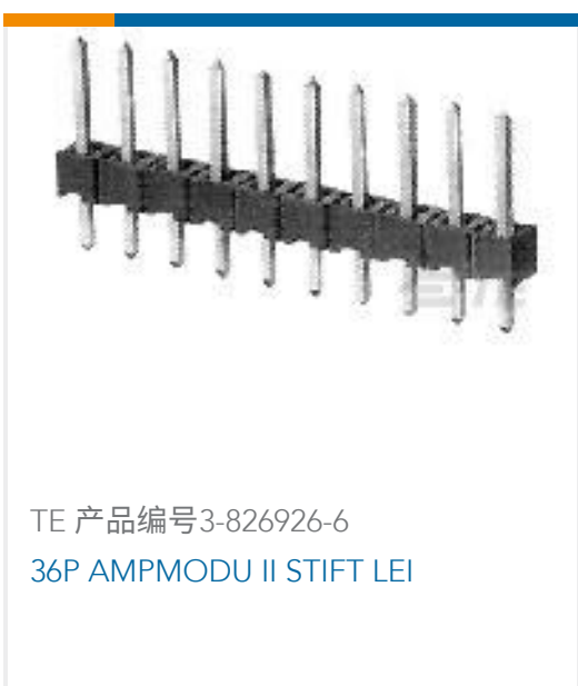
TE 产品编号3-826926-6 36P AMPMODU II STIFT LEI