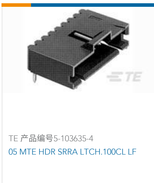
TE 产品编号5-103635-4 05 MTE HDR SRRA LTCH.100CL LF