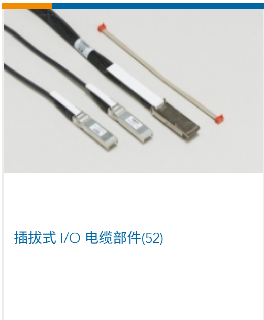
插拔式 I/O 电缆部件(52)