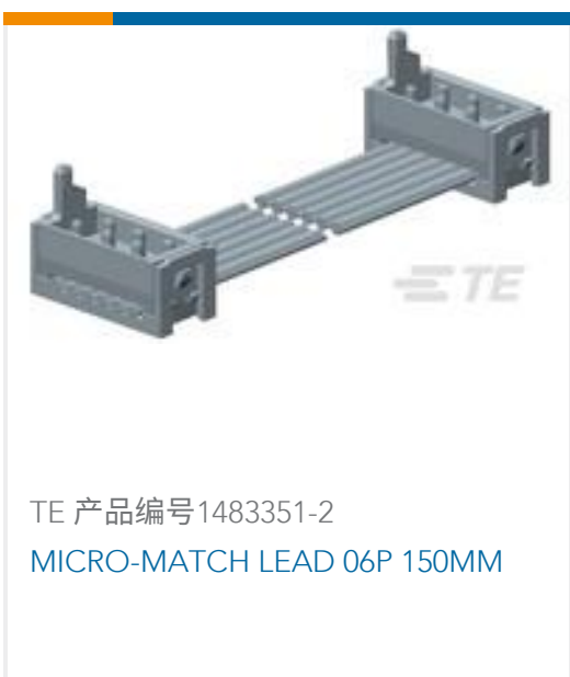
TE 产品编号1483351-2 MICRO-MATCH LEAD 06P 150MM