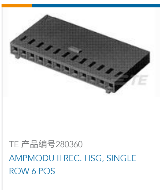
TE 产品编号280360 AMPMODU II REC. HSG, SINGLE ROW 6 POS