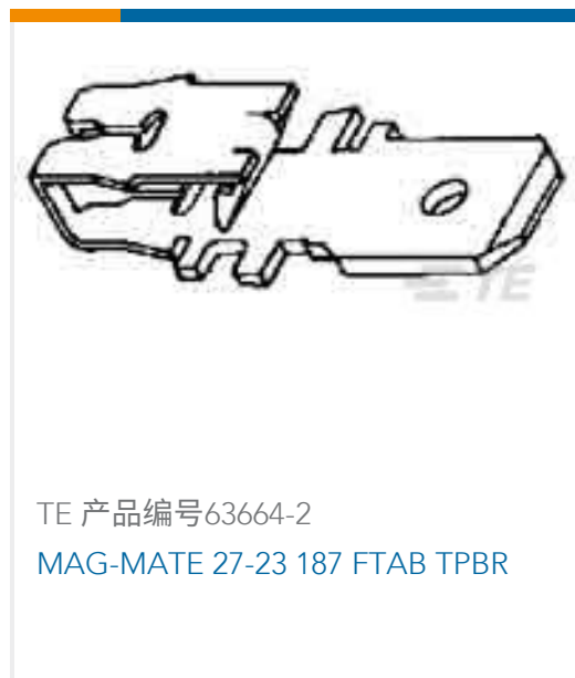
TE 产品编号63664-2 MAG-MATE 27-23 187 FTAB TPBR