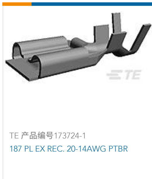
TE 产品编号173724-1 187 PL EX REC. 20-14AWG PTBR