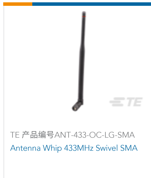
TE 产品编号ANT-433-OC-LG-SMA Antenna Whip 433MHz Swivel SMA