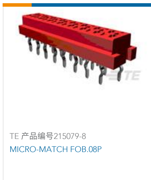
TE 产品编号215079-8 MICRO-MATCH FOB.08P