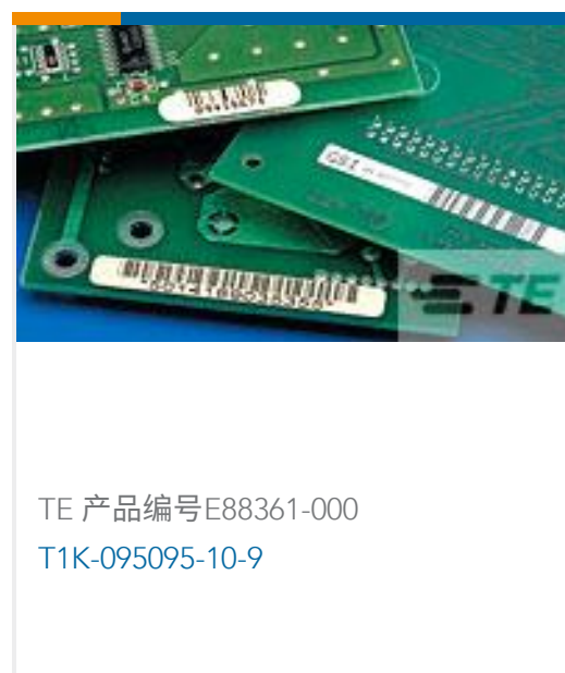
TE 产品编号E88361-000 T1K-095095-10-9