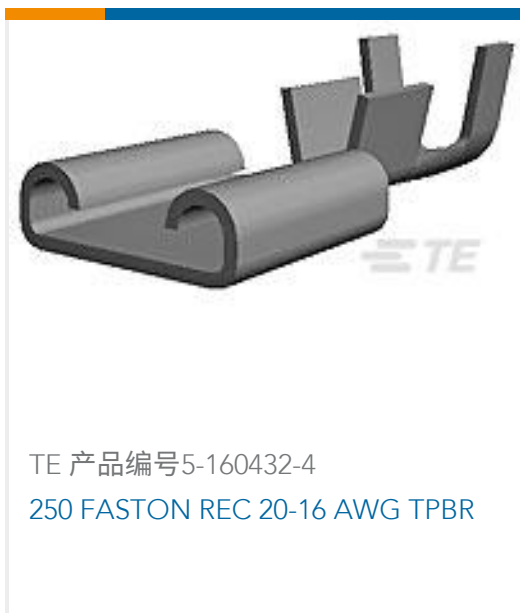
TE 产品编号5-160432-4 250 FASTON REC 20-16 AWG TPBR