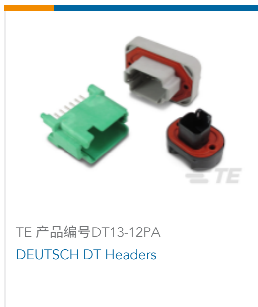
TE 产品编号DT13-12PA DEUTSCH DT Headers