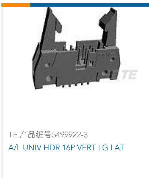
TE 产品编号5499922-3 A/L UNIV HDR 16P VERT LG LAT