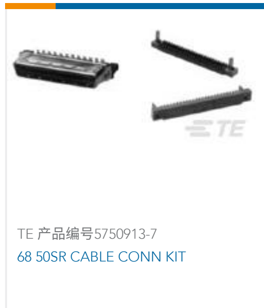
TE 产品编号5750913-7 68 50SR CABLE CONN KIT