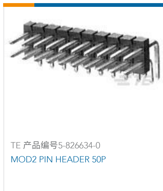
TE 产品编号5-826634-0 MOD2 PIN HEADER 50P