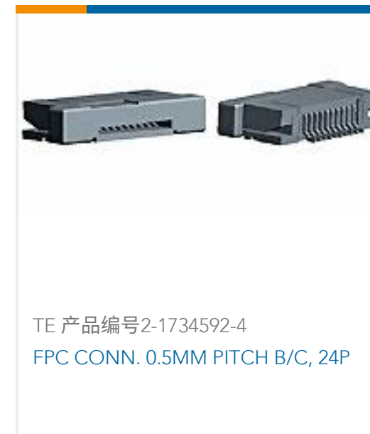
TE 产品编号2-1734592-4 FPC CONN. 0.5MM PITCH B/C, 24P