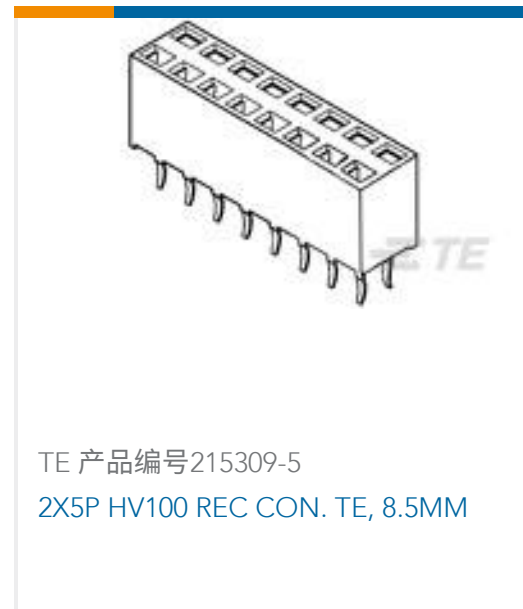
TE 产品编号215309-5 2X5P HV100 REC CON. TE, 8.5MM