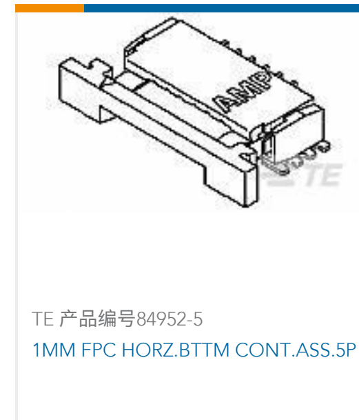
TE 产品编号84952-5 1MM FPC HORZ.BTTM CONT.ASS.5P