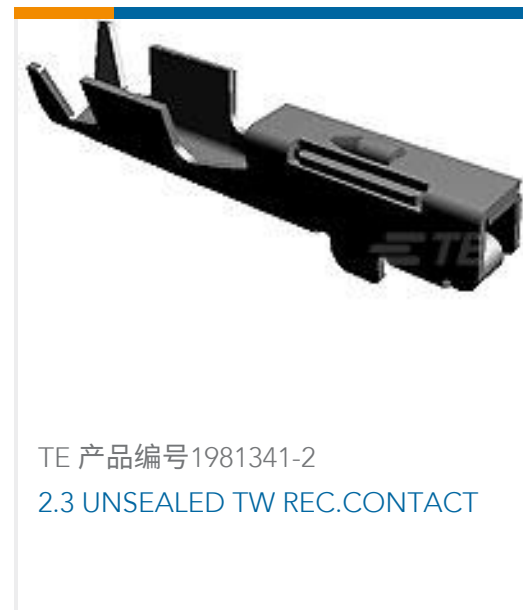
TE 产品编号1981341-2 2.3 UNSEALED TW REC.CONTACT