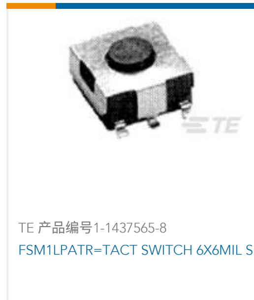
TE 产品编号1-1437565-8 FSM1LPATR=TACT SWITCH 6X6MIL S