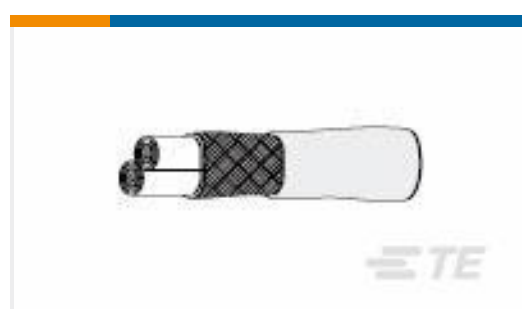
TE 产品编号384506-000 44A1121-24-4/6-0