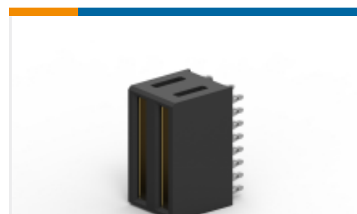
TE 产品编号2204423-1 MULTI-BEAM HD VERTICAL REC. 2P