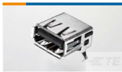
TE 产品编号292303-1 Std USB Type A, R/A, T/H