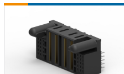
TE 产品编号2204420-1 MULTI-BEAM HD VERTICAL REC. 15S+2P+2P+15