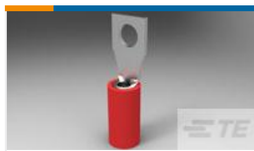
TE 产品编号325148 PIDG RECT 22-16COMM 22-18MIL 2