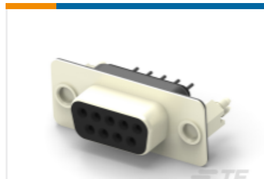
TE 产品编号2301838-1 AMPL REC HD20, VERT, 9P, B/L,4-40 INS