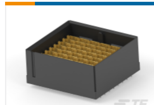
TE 产品编号2187422-1 SW PIR HDR BFP, 85OHM, 8X6 DEW