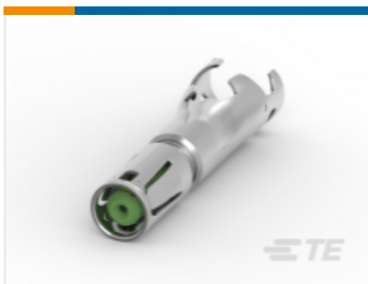
TE 产品编号2298116-1 MATE-AX, Socket outer contact, RTK 031