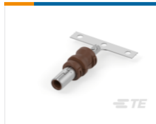
TE 产品编号2203264-7 CAVITY INSERT ASM, INLINE MALE, FAKRA