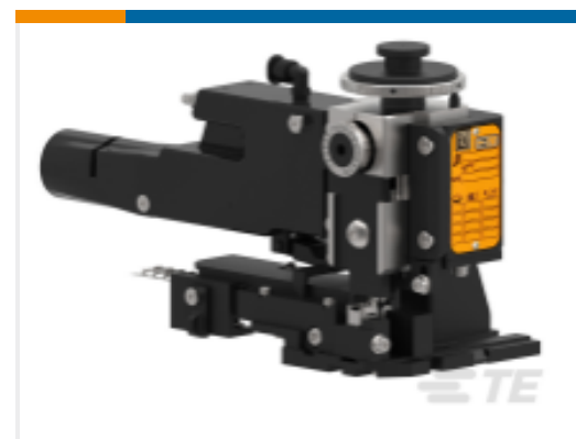
TE 产品编号2836234-2 OCEAN_2.0_Applicator-S134O