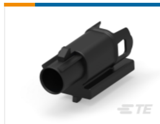
TE 产品编号2307199-1 1POS, FAKRA AUT, PIN OUTER HSG, SLD, 180 DEG