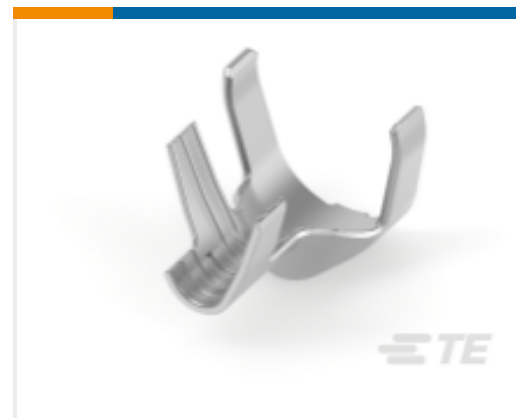
TE 产品编号2272633-2 CU ALLOY, OUTER FERRULE, COAX