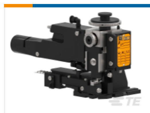
TE 产品编号2836235-2 OCEAN_2.0_Applicator-S-108O-SSA