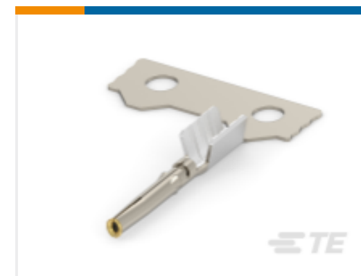
TE 产品编号4-2203270-5 CENTER CONTACT, IN-LINE FEMALE, FAKRA