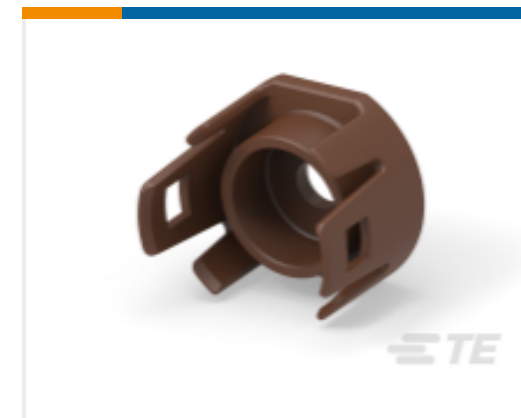
TE 产品编号2289592-2 SEAL COVER, 180 DEGREE, FAKRA