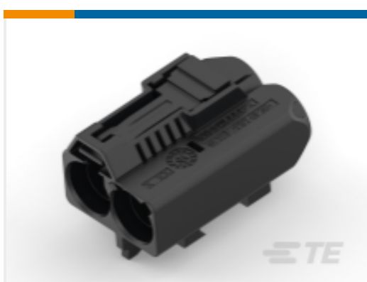
TE 产品编号2345658-1 HOUSING, 2P, INLINE FEMALE, CLIP, FAKRA