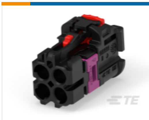
TE 产品编号2-2298721-1 4 P, MATE-AX SOC HSG W CPA, COD A