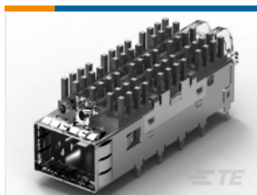
TE 产品编号 1888971-1 Cage Assy Thru Bezelw/LP San, QSFP