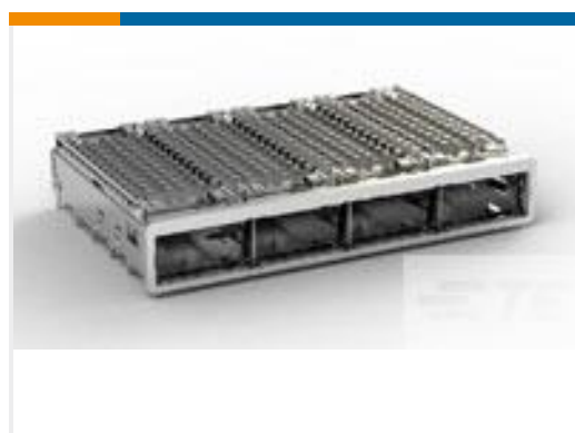
TE 产品编号 2007625-1 1x4 QSFP Kit Assy Bhnd Bzl, PCI