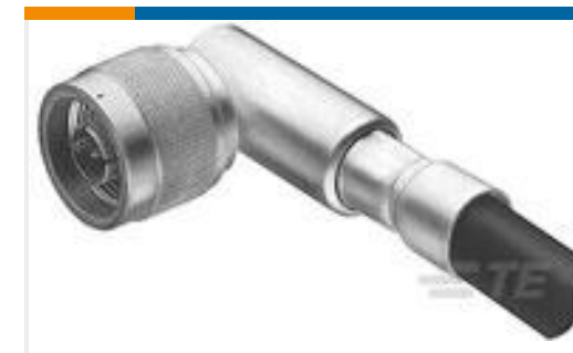
TE 产品编号 225014-3 SERIES N RT ANG PLUG