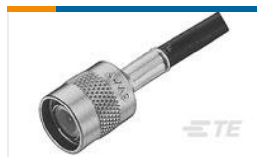
TE 产品编号 1-225550-2 TNC PLUG