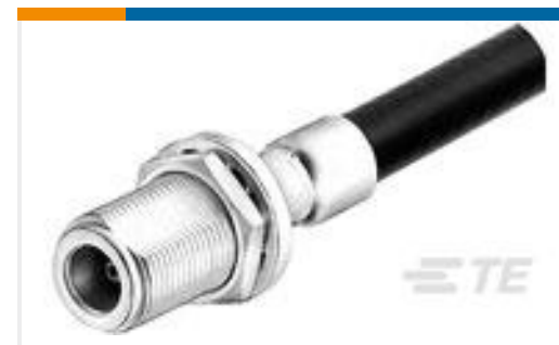
TE 产品编号 225094-2 N SER BHD JACK WEATHERPROOF