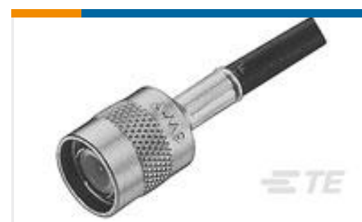
TE 产品编号 1-225550-3 TNC PLUG