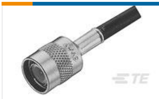
TE 产品编号 225550-8 TNC PLUG DUAL W/P