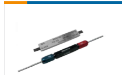
TE 产品编号 523763-3 PLUG GAUGE, HANDTOOL