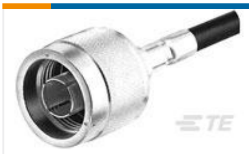
TE 产品编号 225092-7 N SER PL WEATHERPROOF