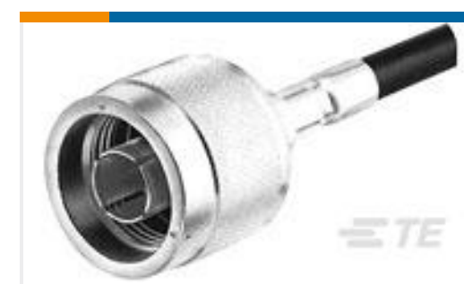
TE 产品编号 225092-2 N SER PL WEATHERPROOF