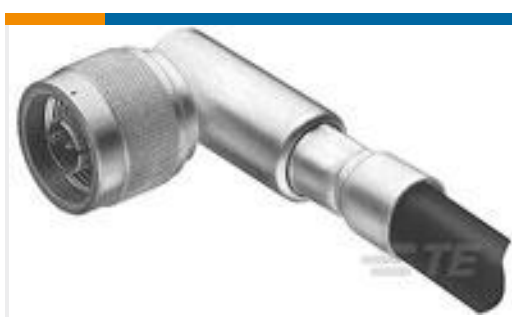
TE 产品编号 225389-6 COAX CONNECTOR, N SERIES