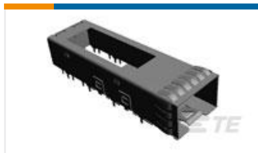
TE 产品编号2110304-1 SFP+ 1x1 Cage Assembly, Solder Tail