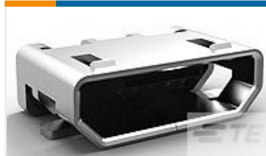
TE 产品编号2174507-2 MICRO USB, TYPE B