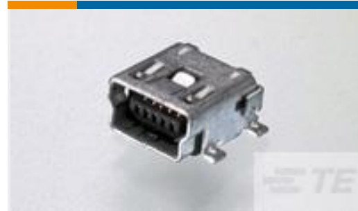
TE 产品编号1-1734035-2 MINI USB, TYPE B, R/A, SMT