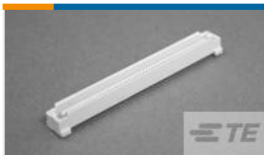
TE 产品编号5177984-6 0.8FH,P05H.5,140,08/Sn,TU