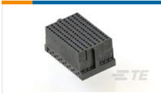
TE 产品编号1934949-1 Tinman 5pr 8col vert recpt 15mm stack