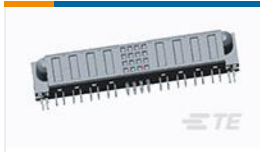
TE 产品编号2-6450880-4 MBXLE R/A RCPT 4P16S4P