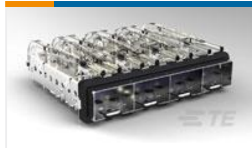
TE 产品编号2110570-1 SFP+ 1x4 Cage Assembly Square Light Pipe