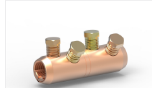
TE 产品编号1974102-1 CSBS-300-750