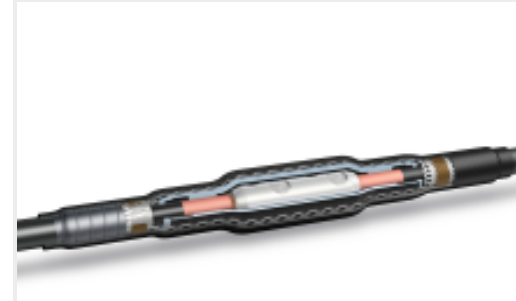
TE 产品编号CF6026-000 CSJA-1522