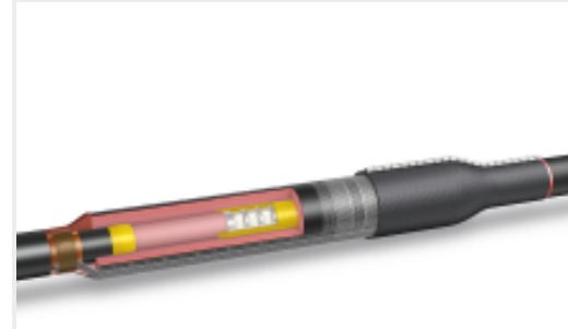
TE 产品编号CL7586-000 HVS-C-1523S