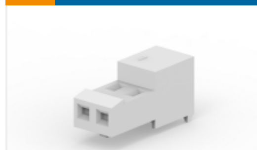
TE 产品编号3-640441-9 MTA Receptacle: Nylon, Tin Plated, 2.54 mm