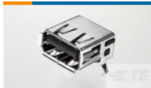
TE 产品编号292303-7 Std USB Type A, R/A, SMT, Offset, Natural