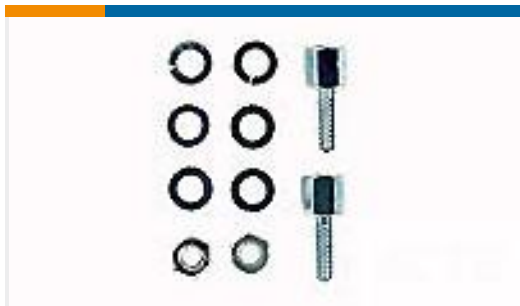
TE 产品编号5205817-2 FEMALE SCREWLOCK KIT,BULK PKG