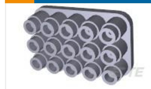
TE 产品编号794282-1 15P UMNL WIRE SEAL