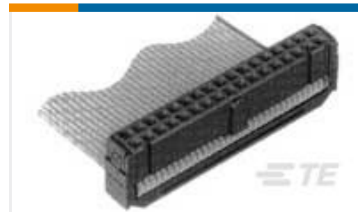
TE 产品编号1658622-5 24 NOVO MIL/CTR 30DP,LEAD FREE