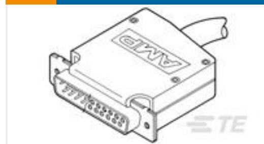
TE 产品编号5205730-1 CLAMSHELL ASY SIZE 2