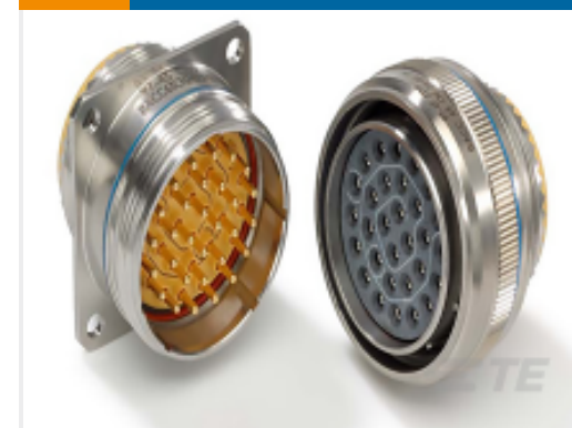
TE 产品编号ZPF000000000009138 983-7SE 12-12 SN