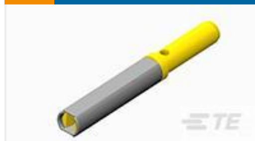
TE 产品编号450213-000 CTA-0165