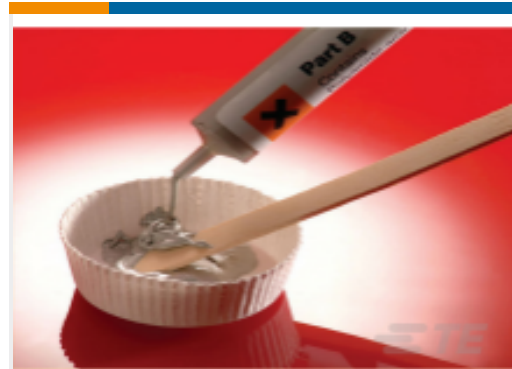
TE 产品编号369276-000 S1184-KIT-1