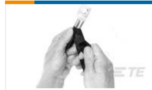
TE 产品编号605980-1 FUSION TAPE, .75\"X .020\"X 30FT