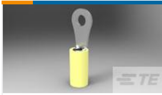
TE 产品编号35148 TERMINAL,PIDG R 12-10 4