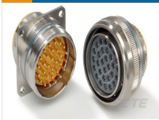
TE 产品编号ZPF000000000203826 983-15 KV 4-10-06 PN-L