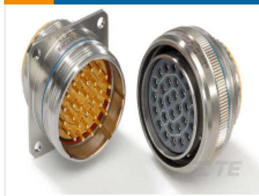
TE 产品编号ZPF000000000114004 983-15 KV 4-18-31 S6 L