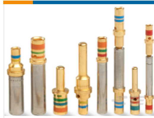
TE 产品编号ZPF000000000121739 182-0862-22