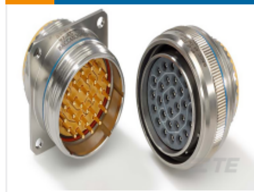
TE 产品编号ZPF200000000008792 983-6SE 12-03 SN-L