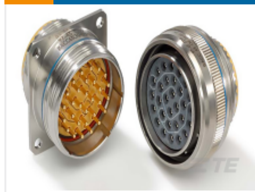
TE 产品编号ZPF000000000008736 983-6SE 08-98 SN-L