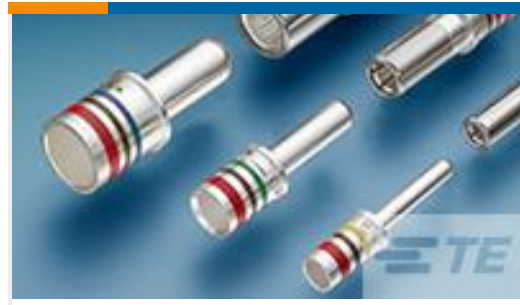
TE 产品编号0660-206-0882 CONT PIN