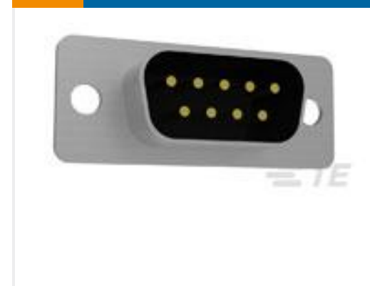
TE 产品编号5-747904-2 9 Plug Solder Cup, Gold Flash,