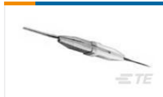
TE 产品编号91067-2 INSERTION/EXTRACTION TOOL