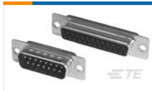
TE 产品编号5-747905-5 9 Rcpt Solder Cup, 30 gold, Ro