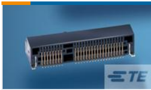
TE 产品编号2041262-1 Mini PCI-E 6.8H G/F