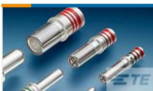
TE 产品编号 0662-207-0082 CONT SOC ASSY