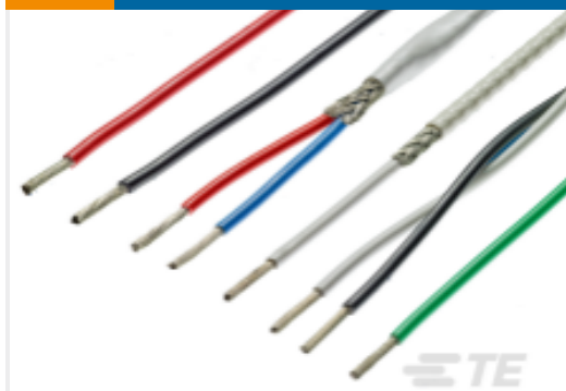
TE 产品编号CQ85733001 100G0131-0.15-2/6/9