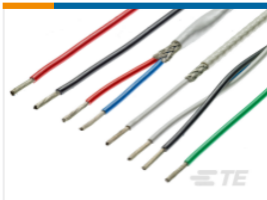
TE 产品编号2823013001 44A0211-8-9