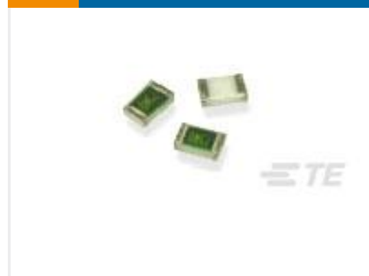
TE 产品编号6-1879127-7 RN 0402 422R 0.1% 10PPM CUT LENGTH