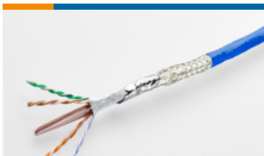
TE 产品编号EM4928-000 C6A-26C444XN14-0