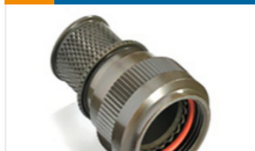
TE 产品编号BTH1-11-08-1-B-SB BTH1-11-08-1-B-SB