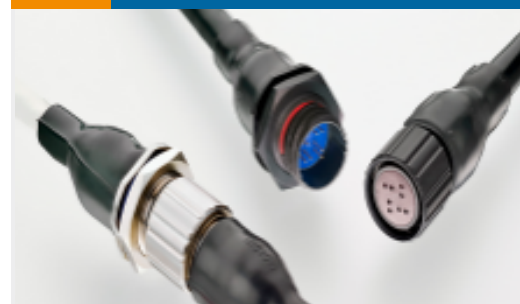
TE 产品编号2102353-3 CeeLok FAS-T, Plug Kit, Ni, A