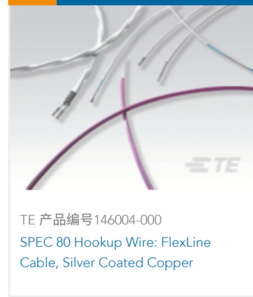
TE 产品编号146004-000 SPEC 80 Hookup Wire: FlexLine Cable, Silver Coated Copper