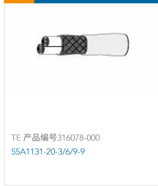
TE 产品编号316078-000 55A1131-20-3/6/9-9