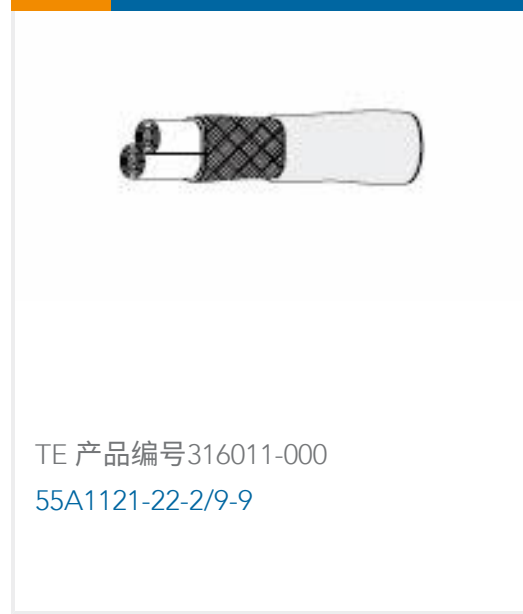
TE 产品编号316011-000 55A1121-22-2/9-9