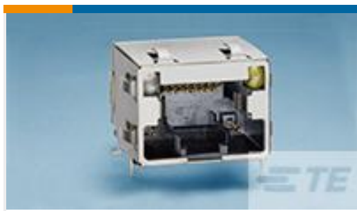
TE 产品编号 2178126-1 Jack, CLOUDSPLITTER SMT SHIELDED