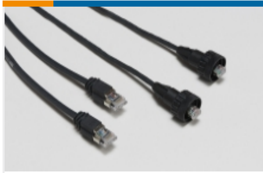
模块化绞合线对电缆组件(3)