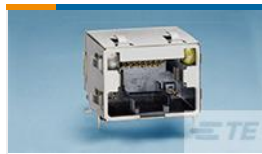
TE 产品编号 2178126-2 Jack, CLOUDSPLITTER SMT SHIELDED