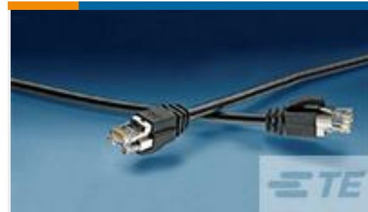
TE 产品编号2178127-1 Cable assy CLOUDSPLITTER - 2m