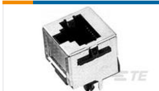
TE 产品编号1705549-1 Invertible Modular Jack 8P shielded