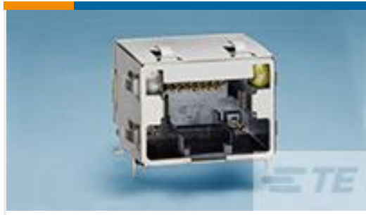
TE 产品编号 2178126-1 Jack, CLOUDSPLITTER SMT SHIELDED