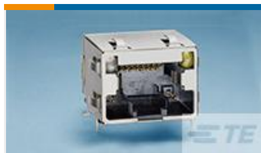
TE 产品编号2178126-1 Jack, CLOUDSPLITTER SMT SHIELDED