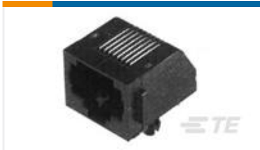
TE 产品编号5557314-1 MJ,LPF,R/A,6P/6C,SMT,TRAY PACK