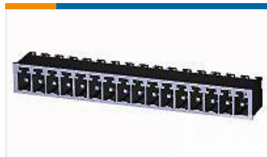
TE 产品编号284514-2 2 POS TERMI-BLOK HDR DIR. POL.