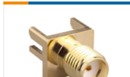
TE 产品编号L9000279-01 SMA Jack 50 Ohm .062 PCB Edge Mount