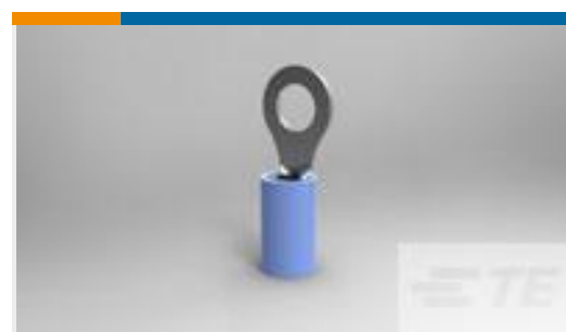
TE 产品编号130094 PIDG RING