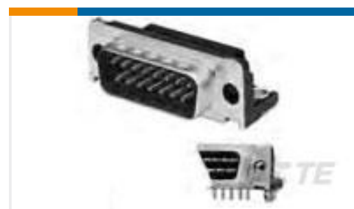
TE 产品编号5747236-4 15 MSFL PLUG RA 318 (IN,FM)