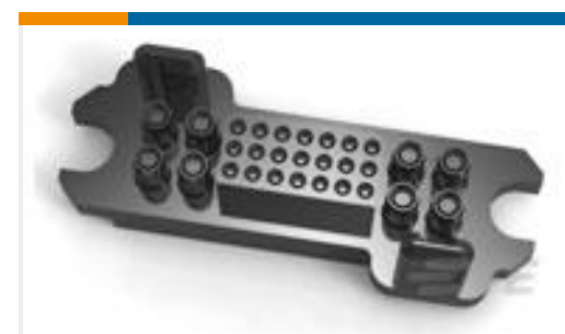
TE 产品编号1648206-1 298-08-01100=SA CONN,SKT