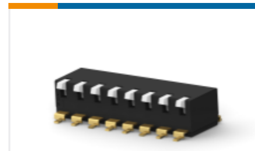
TE 产品编号2319764-4 E STACK PIANO 8P G LONG TUBE PD ON