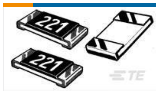
TE 产品编号2-2176231-7 3522 120R 1% 3W