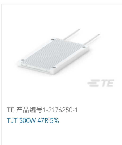
TE 产品编号1-2176250-1 TJT 500W 47R 5%