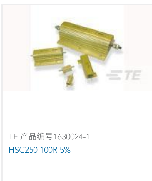
TE 产品编号1630024-1 HSC250 100R 5%