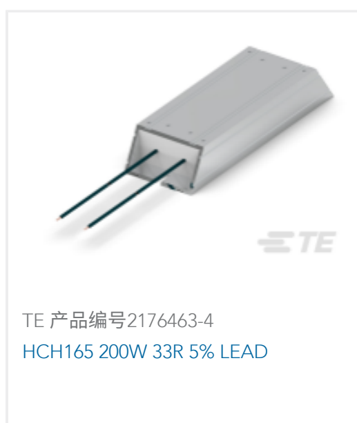
TE 产品编号2176463-4 HCH165 200W 33R 5% LEAD