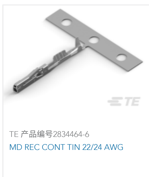
TE 产品编号2834464-6 MD REC CONT TIN 22/24 AWG