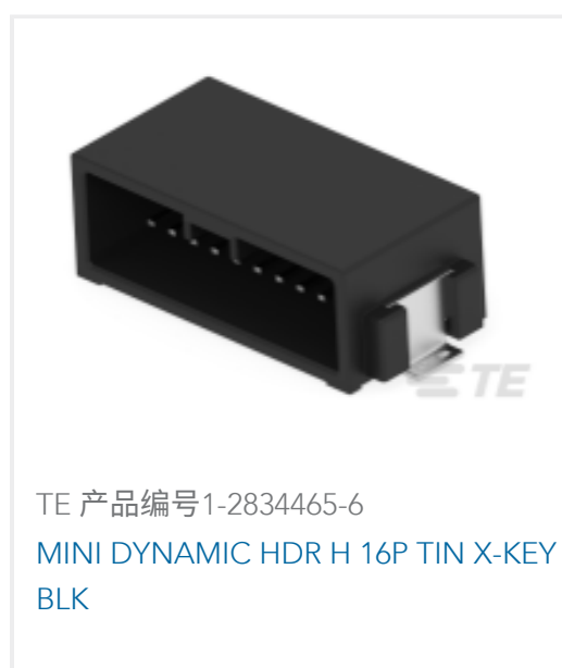
TE 产品编号1-2834465-6 MINI DYNAMIC HDR H 16P TIN X-KEY BLK