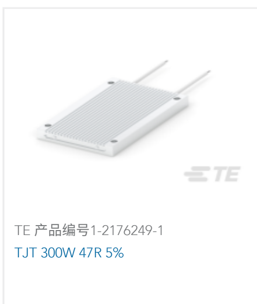
TE 产品编号1-2176249-1 TJT 300W 47R 5%