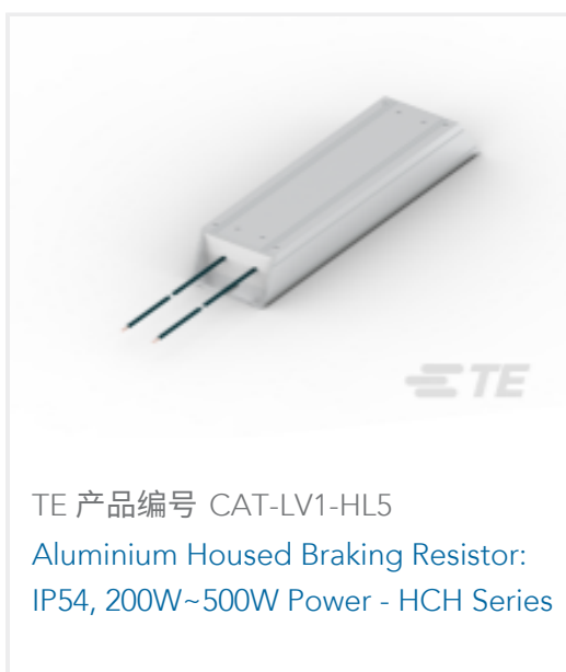
TE 产品编号 CAT-LV1-HL5 Aluminium Housed Braking Resistor: IP54, 200W-500W Power - HCH Series