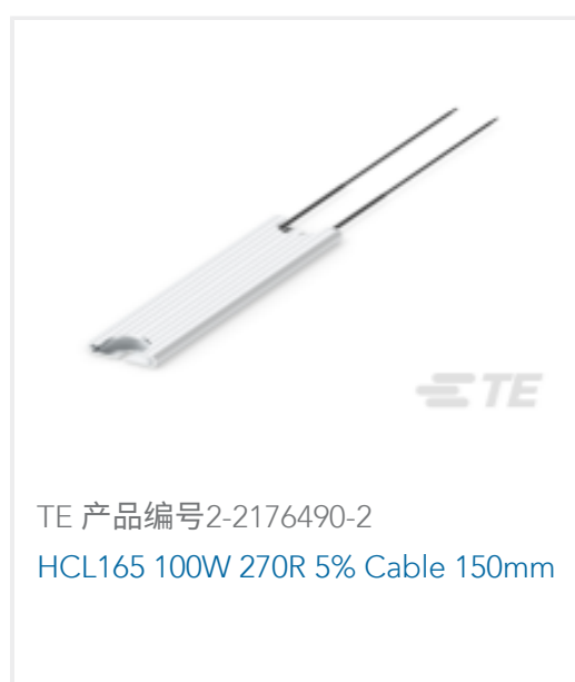
TE 产品编号2-2176490-2 HCL165 100W 270R 5% Cable 150mm