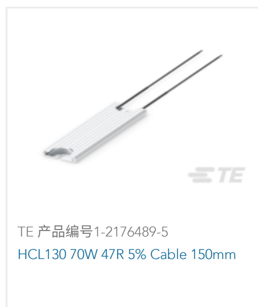
TE 产品编号1-2176489-5 HCL130 70W 47R 5% Cable 150mm BLK