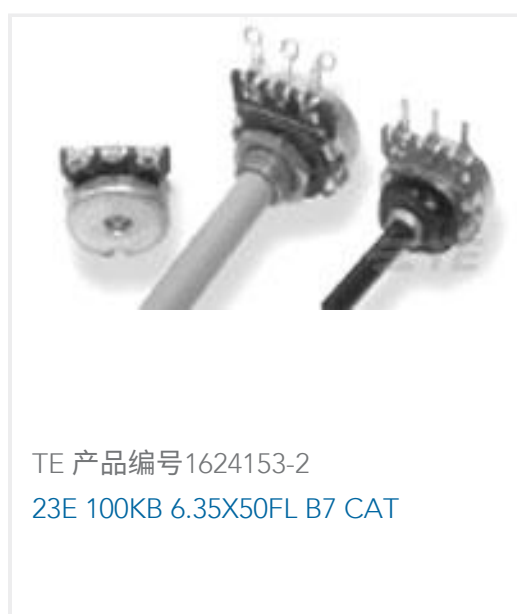
TE 产品编号1624153-2 23E 100KB 6.35X50FL B7 CAT