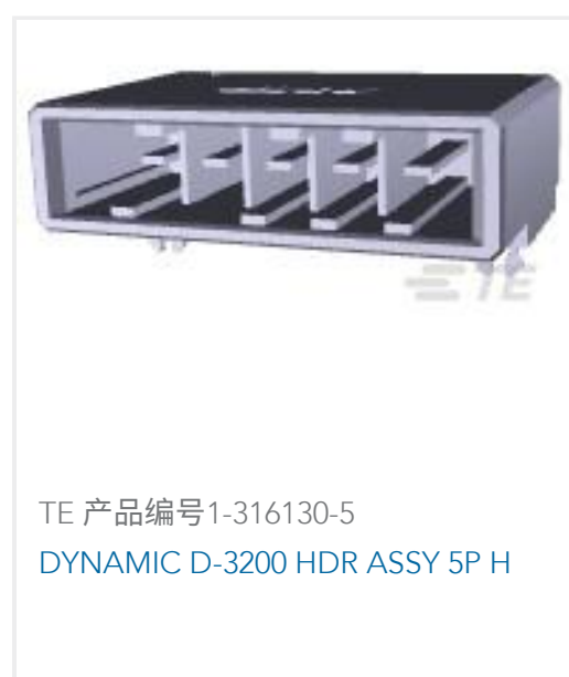
TE 产品编号1-316130-5 DYNAMIC D-3200 HDR ASSY 5P H