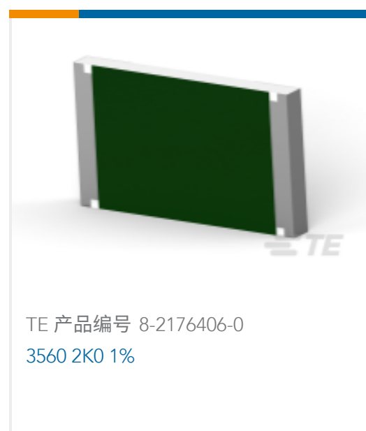
TE 产品编号 8-2176406-0 3560 2K0 1%