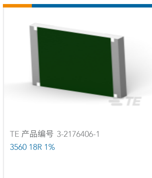
TE 产品编号 3-2176406-1 3560 18R 1%