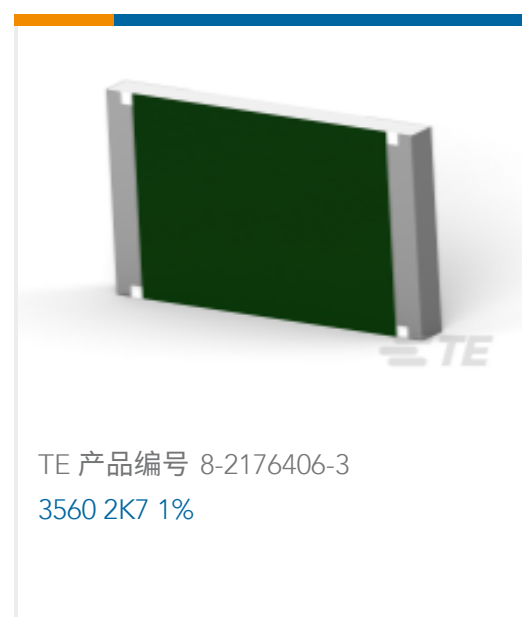
TE 产品编号 8-2176406-3 3560 2K7 1%