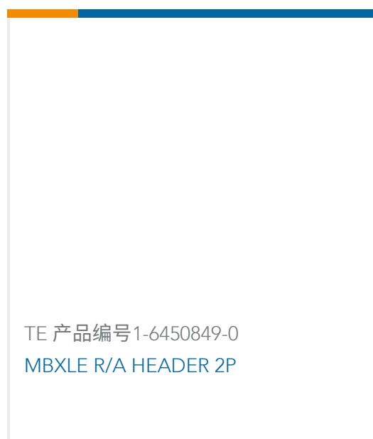
TE 产品编号1-6450849-0 MBXLE R/A HEADER 2P