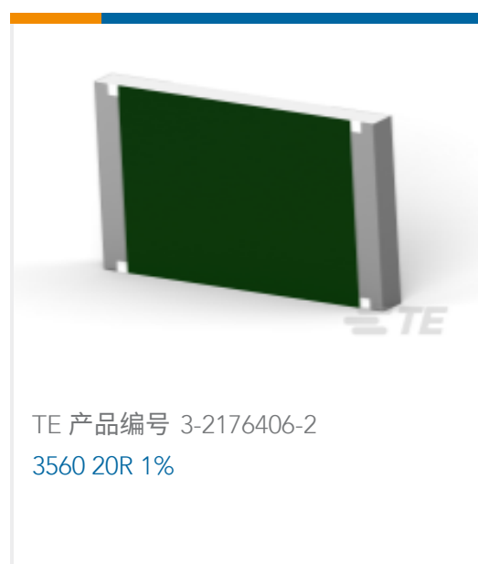
TE 产品编号 3-2176406-2 3560 20R 1%