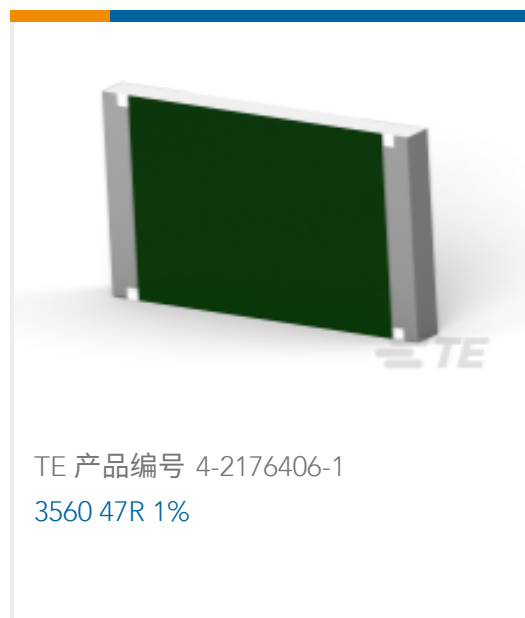
TE 产品编号 4-2176406-1 3560 47R 1%