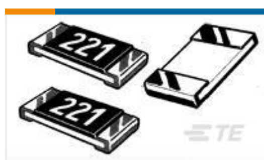
TE 产品编号1-2176230-5 3522 12R 5% 3W