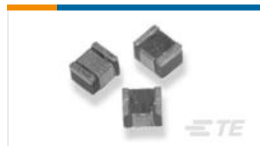
TE 产品编号1624112-2 3650 0603 12nH 5% 2K RL