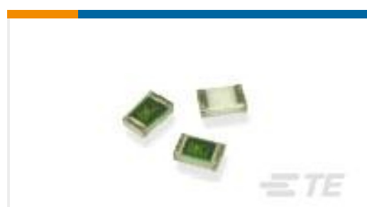
TE 产品编号7-2176087-8 RP 1J 0.166W 442R 0.1% 25PPM 1K RL