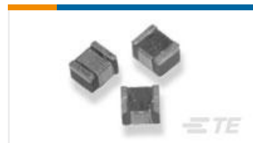
TE 产品编号1624112-5 3650 0603 33nH 5% 2K RL