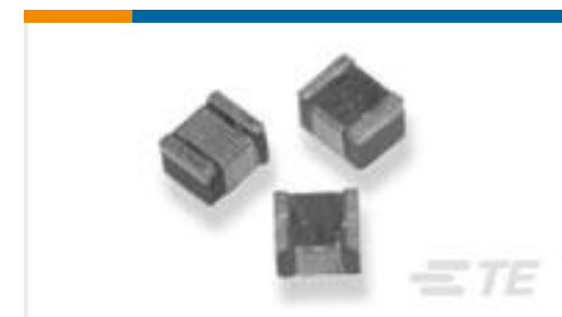
TE 产品编号9-1624112-2 3650 0603 0.27uH 5% 2K RL