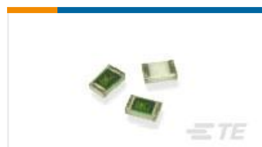
TE 产品编号2176088-8 RP 1J 0.166W 887R 0.1% 25PPM 1K RL