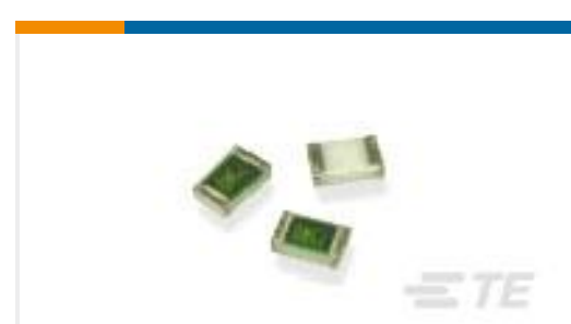
TE 产品编号2176088-8 RP 1J 0.166W 887R 0.1% 25PPM 1K RL