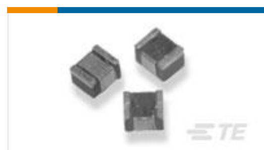
TE 产品编号1624112-2 3650 0603 12nH 5% 2K RL