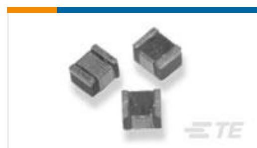
TE 产品编号9-1624112-2 3650 0603 0.27uH 5% 2K RL