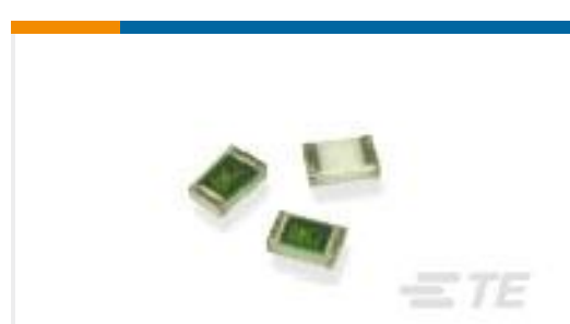
TE 产品编号7-2176087-8 RP 1J 0.166W 442R 0.1% 25PPM 1K RL