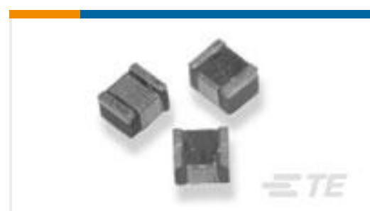
TE 产品编号1624112-5 3650 0603 33nH 5% 2K RL