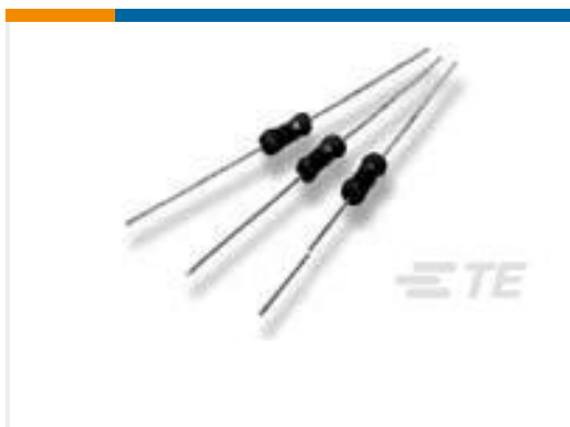
TE 产品编号7-1879354-5 RR03 5% 390R AMMO