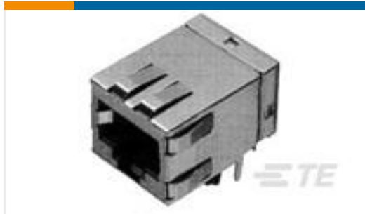
TE 产品编号5406299-1 MJ ASSY,S/P,8POS,SH,RVPGT,CAT 5e