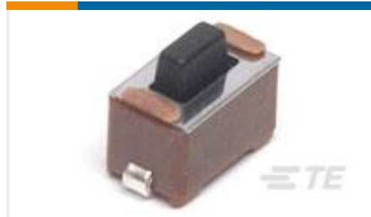
TE 产品编号147873-1 SWITCH,TACT,SMT,J-LEAD,5.0MM