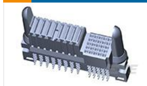
TE 产品编号2-1926739-5 AssyMinipak HdI25s10pRARecptSc