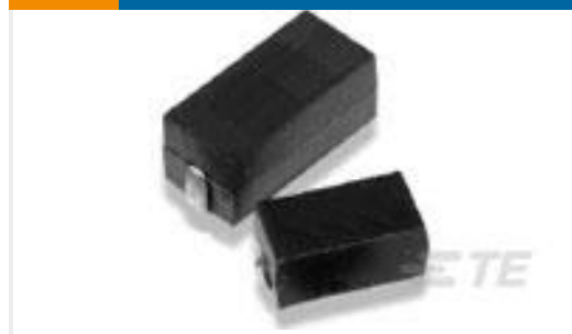
TE 产品编号6-1879022-5 SMF3 150K 5%