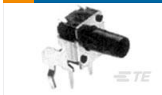
TE 产品编号1-1825027-7 FSMRA6JH04=R/A,TACT PB SW,160G