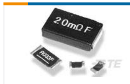
TE 产品编号2176155-6 TLM 0805 0.25W R027 5% 100PPM 5K RL