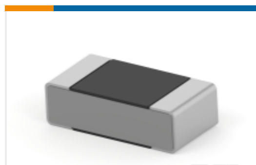
TE 产品编号9-1879132-1 RN 0402 19K6 0.1% 10PPM 5K RL