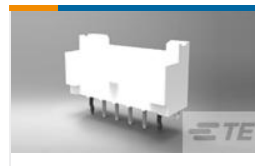
TE 产品编号2132230-7 EP2.5 Shrouded HDR ASSY 7P VER