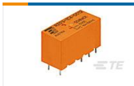
TE 产品编号3-1415899-9 RZ01-1A3-D012