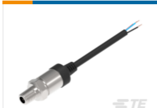
TE 产品编号20014203-12 PRESS XDCR M325M-000005-250PG