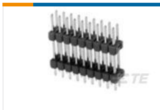
TE 产品编号5-146496-2 04 MODII HDR DRST UNSHRD STKG