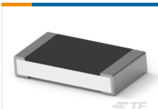
TE 产品编号1-2176391-0 RQ 1206 15K4 0.1% 10PPM 5K RL