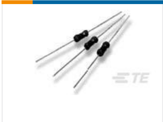
TE 产品编号1-1879353-9 RR02 5% 24K AMMO