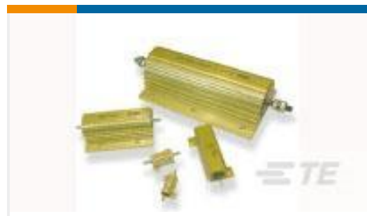
TE 产品编号9-1625971-5 HSA25 R01 10%