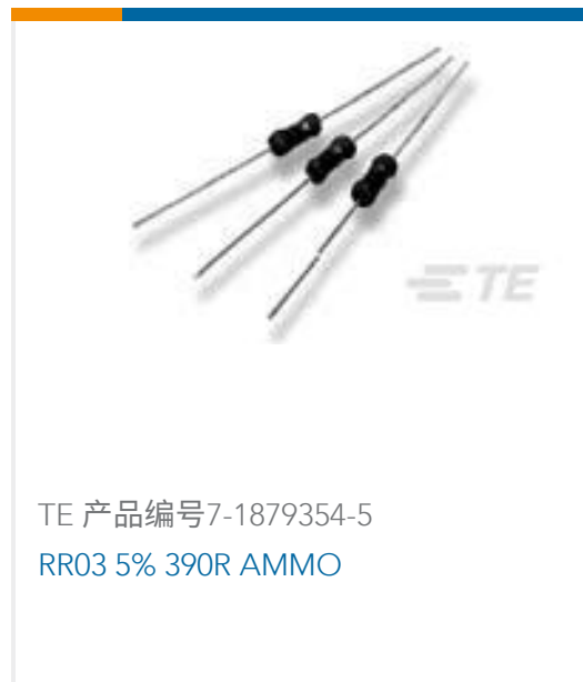
TE 产品编号7-1879354-5 RR03 5% 390R AMMO