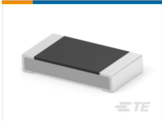
TE 产品编号2-2176392-9 RQ 1206 261K 0.1% 10PPM 5K RL