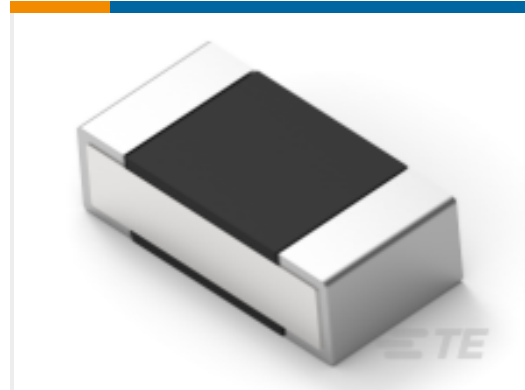
TE 产品编号3-2176307-2 RP 1E 0.1W 26K1 0.1% 25PPM 5K RL