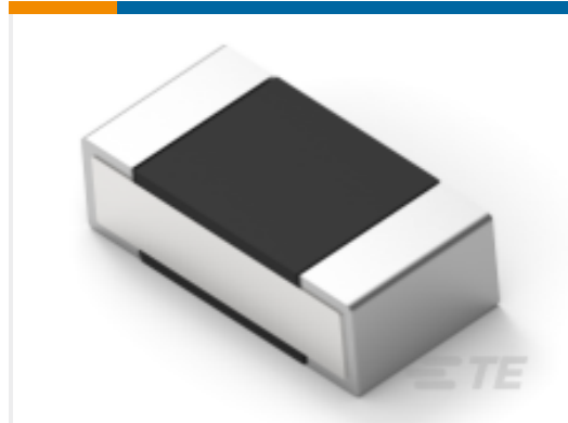
TE 产品编号7-2176305-3 RP 1E 0.1W 604R 0.1% 25PPM 5K RL