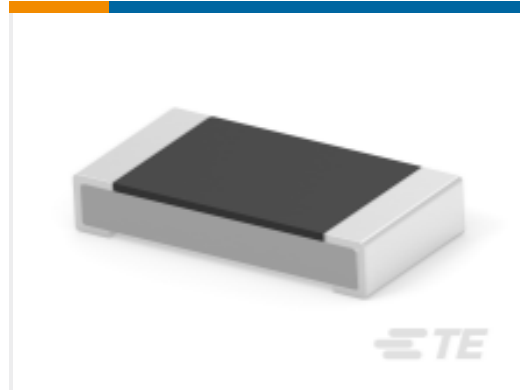
TE 产品编号2-2176392-9 RQ 1206 261K 0.1% 10PPM 5K RL