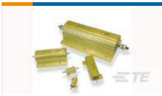
TE 产品编号9-1625971-5 HSA25 R01 10%