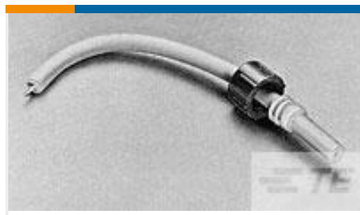
TE 产品编号1-830611-0 LGH 1/2 SNGL MLD END