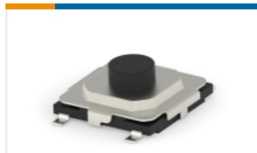
TE 产品编号2337238-3 TACT MINI GW 5.2X5.2X2 160GF