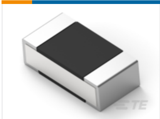
TE 产品编号3-2176307-2 RP 1E 0.1W 26K1 0.1% 25PPM 5K RL