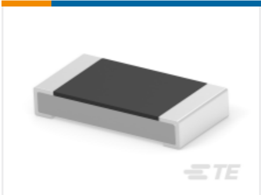
TE 产品编号2-2176392-9 RQ 1206 261K 0.1% 10PPM 5K RL