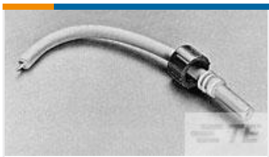
TE 产品编号1-830611-0 LGH 1/2 SNGL MLD END