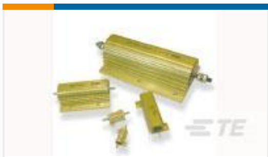
TE 产品编号9-1625971-5 HSA25 R01 10%