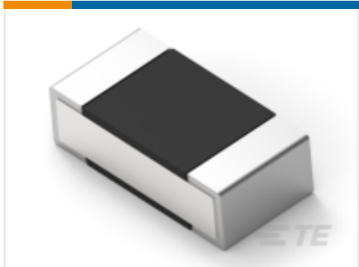
TE 产品编号7-2176305-3 RP 1E 0.1W 604R 0.1% 25PPM 5K RL