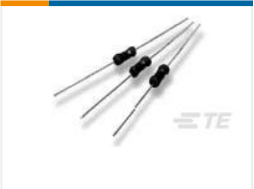
TE 产品编号1-1879353-9 RR02 5% 24K AMMO