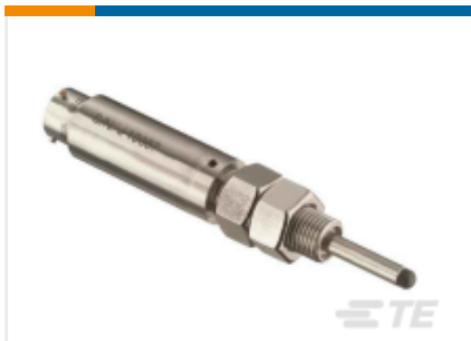
TE 产品编号02350510-000 GA-HD GCD-121-125 ASSY