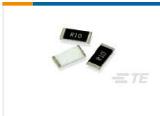
TE 产品编号6-1622824-4 RL73N 1J R18 5% 5K RL