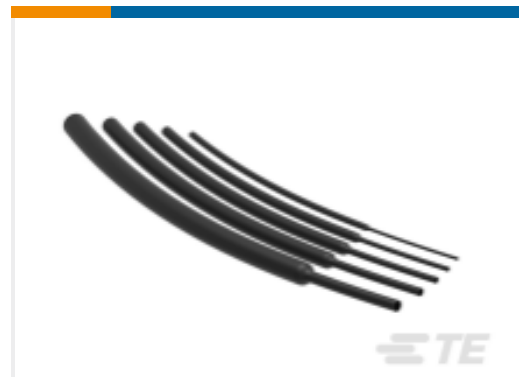
TE 产品编号NB20274001 VERSAFIT-3/16-0-SP