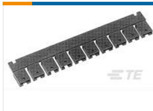
TE 产品编号2-382811-1 SHUNT, ECON, PHBRSN, BLACK