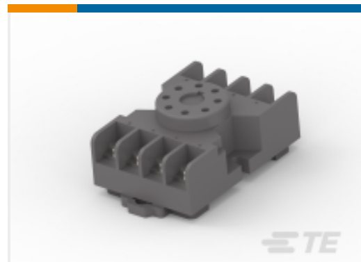
TE 产品编号2-1419106-3 27E891=SOCKET,KRPA,8,OCTAL,POL