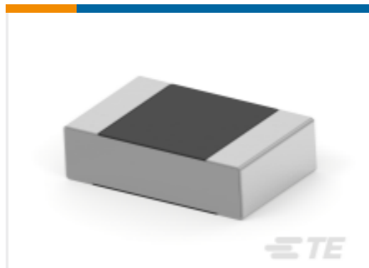
TE 产品编号2-1614959-8 CPF0805 1M43 0.1% 25PPM 1K RL