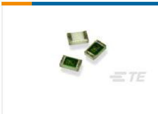
TE 产品编号4-1676481-3 CPF 0603 330R 0.1% 25PPM 1K RL