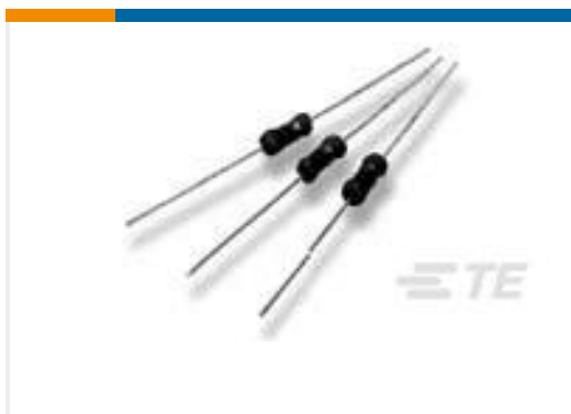
TE 产品编号1879350-5 RR01 5% R33 AMMO