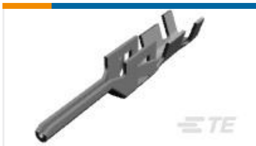
TE 产品编号1-794612-2 PIN CONT 20-24 30 GOLD L/P