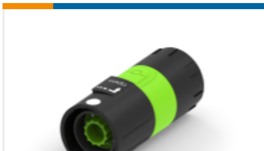
TE 产品编号ESB001N00310001000 615 PLUG