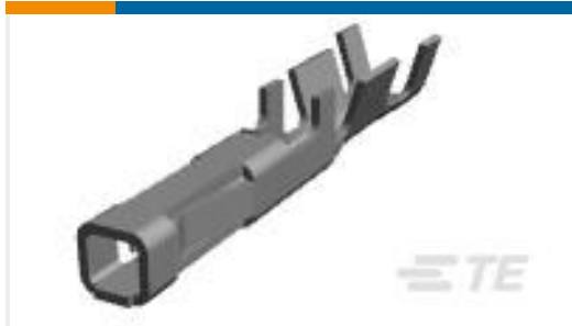
TE 产品编号1-794610-2 MICRO MNL RPT CNT,LS PC 30AU L