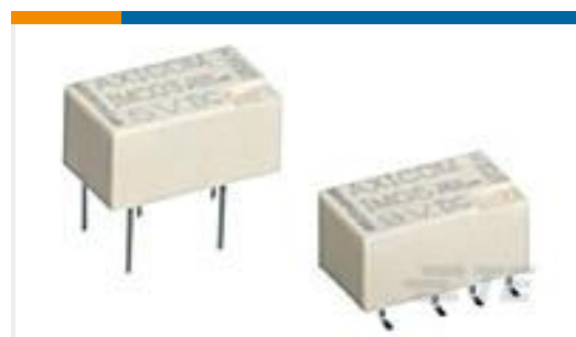
TE 产品编号1462042-3 IMC06GR=IM RELAY 140mW 12V 1CO