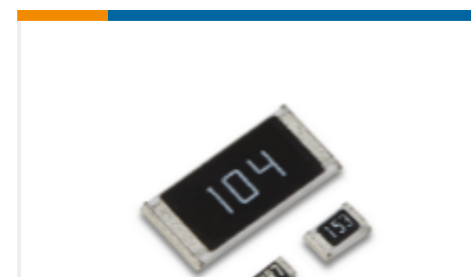
TE 产品编号4-2176337-1 CRGCQ 0402 22K 1%