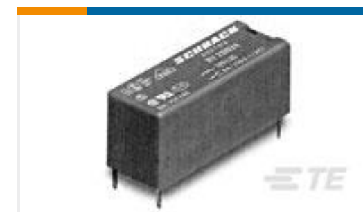
TE 产品编号2-1393225-1 RY611024