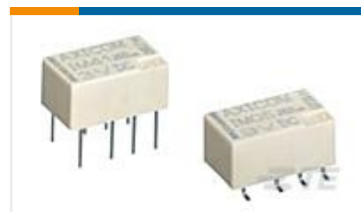
TE 产品编号1-1462039-8 IM06DGR=IM RELAY 140mW 12V