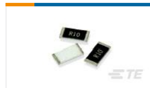
TE 产品编号1879459-1 RL73N 1E R10 1% 5K RL