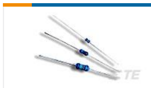
TE 产品编号3-1676913-0 YR1 0.1% 20K