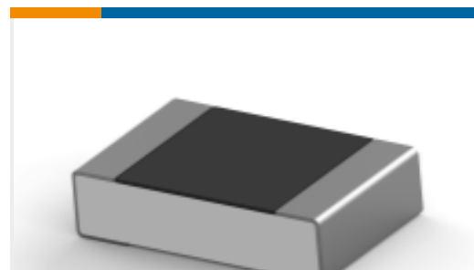
TE 产品编号9-2176380-5 RQ 0805 11K 0.1% 10PPM 5K RL