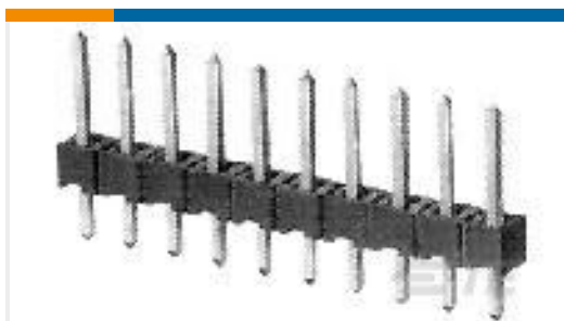
TE 产品编号826648-4 4P AMPMODU II STIFT LEI