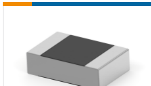
TE 产品编号1-2176264-7 RN 0805 750K 0.1% 10PPM 1K RL