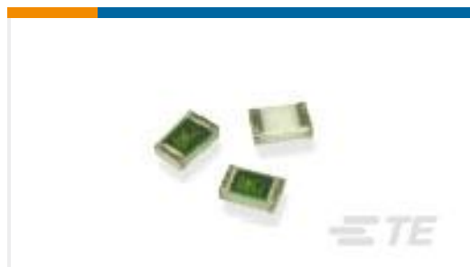
TE 产品编号1676356-2 RN 0805 4K22 0.1% 10PPM 1KRL