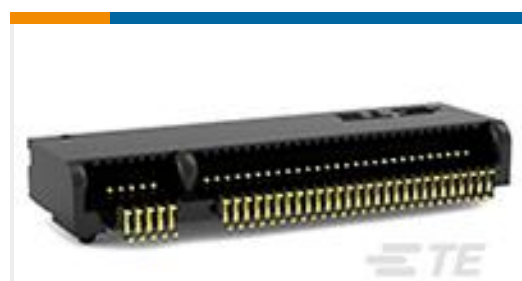
TE 产品编号2199119-5 M.2 0.5PITCH 3.2H KEY B 30U AU