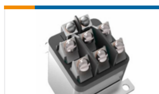
TE 产品编号1617807-5 FC-335-SY8= RELAY, 3PST