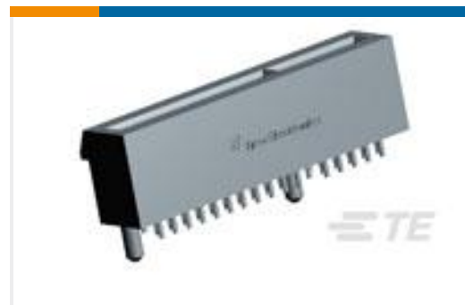
TE 产品编号1871058-2 PCI EXPRESS CONN. EON TYPE, 64P, L=2.0