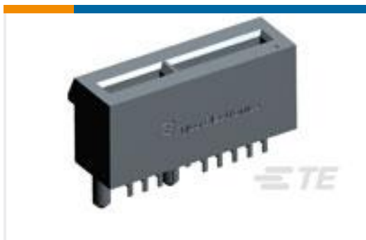
TE 产品编号1871058-1 PCI EXPRESS CONN. EON TYPE, 36P, L=2.0