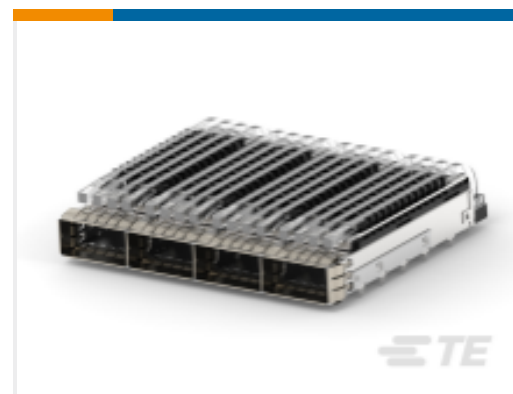
TE 产品编号2349642-3 CAGE ASSY, 1X4, QSFP28, SPRING, HS, LP