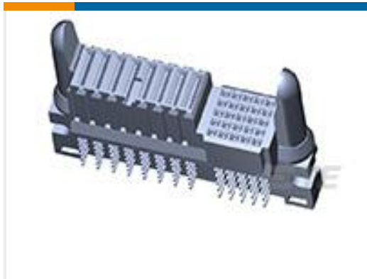
TE 产品编号2-1926739-5 AssyMinipak Hdl25s10pRARceptSc