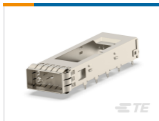
TE 产品编号2337376-1 CAGE ASSEMBLY, QSFP28 1X1, PCI, OP