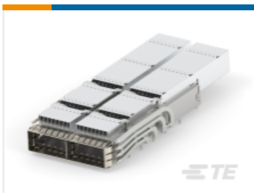
TE 产品编号1-2324313-0 RCPT CAGE ASSY W/ HS &LP 1X2 QSFP-DD