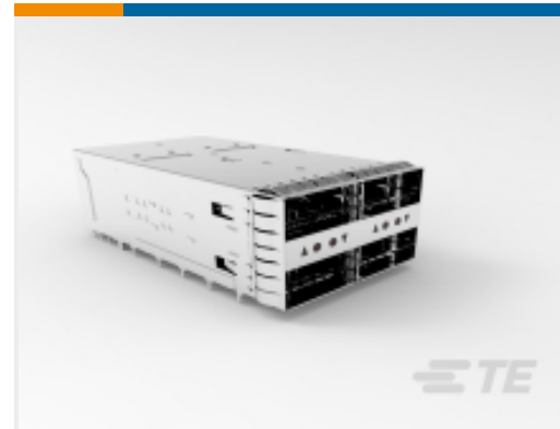
TE 产品编号2289129-5 ZQSFP+ CAGE& CONN 2X2, EMI SPRING, 2 LP