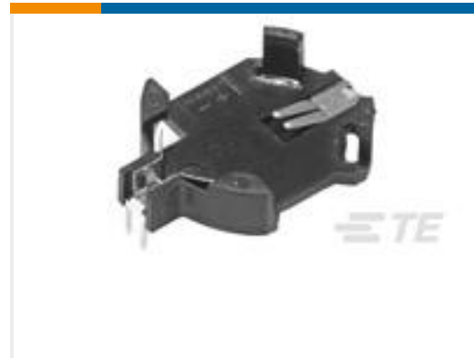
TE 产品编号796136-1 ASSY, SMT BATTERY CONN